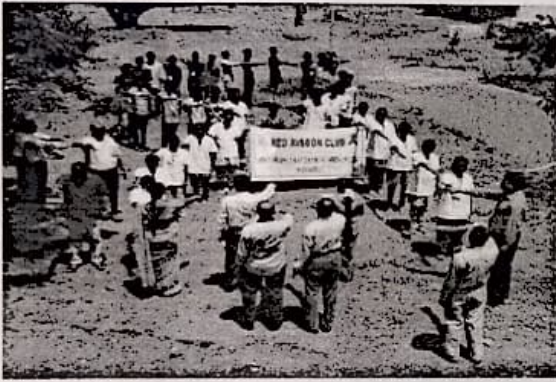
Pledge taken by Students