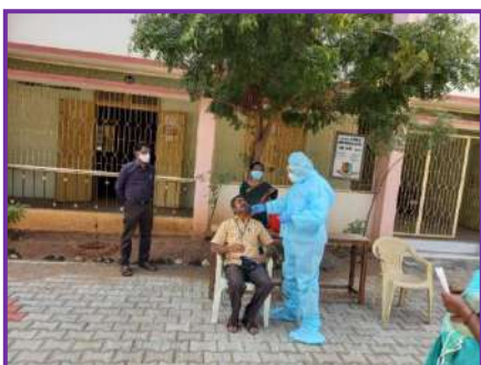
Covid 19 Test Conducted by YRC and RRC for the benefit of students and staffs