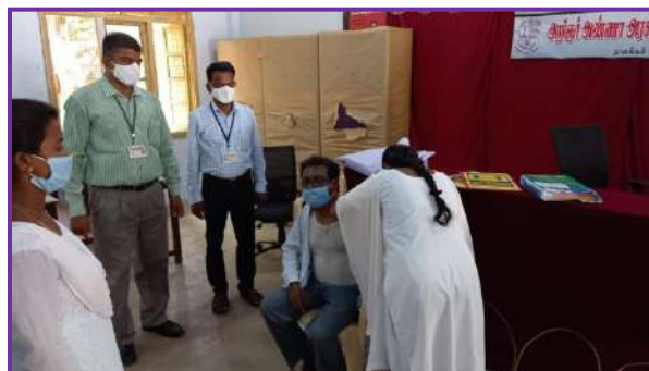
Covid 19 Vaccine Camp conducted by YRC and RRC for the benefit of students and staffs